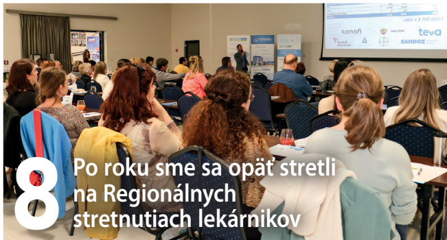
8 Po roku sme sa opäť stretli na Regionálnych stretnutiach lekárníkov