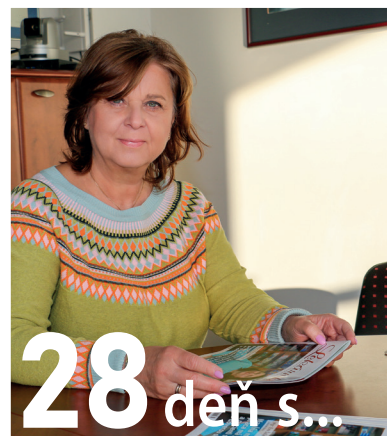
28 deň s...