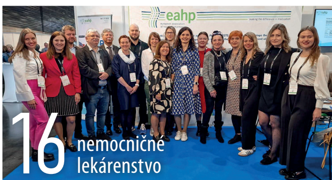
16 nemocničné lekárenstvo