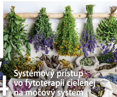
34 Systémový prístup vo fytoterapii cielej na močový systém